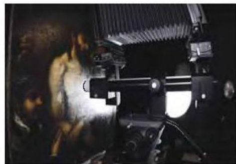
Τεχνική φωτογράφιση έργου του Τισανού στα Εργαστήρια Χαρακτηρισμού Τέχνης «Ανδρέας Πίττας» του Ινστιτούτου Κύπρου.

—Νομίζω ότι είναι σημαντικό να κατανοήσουμε το περιβάλλον στο οποίο μεγάλωσε και ωρίμασε ως ζωγράφος. Η Κρήτη και συγκεκριμένα ο Χάνδακας (σημερινό Ηράκλειο) του 16ου αιώνα ήταν ένα πολυπολιτισμικό περιβάλλον. Ως ένα από σημαντικότερα λιμάνια των Βενετών στην Ανατολική Μεσόγειο, η πόλη χαρακτηριζόταν από τη συνύπαρξη διαφορετικών κοινωνικών και πολιτισμικών ομάδων, κυρίως των ορθόδοξων Κρητών και των καθολικών Ιταλών. Θα έλεγα λοιπόν ότι η πολυπολιτισμικότητα είναι ένα βασικό χαρακτηριστικό του Γκρέκο που αντανακλάται στην ευκολία που είχε να ταξιδέψει, να εξελιχθεί και να μεταμορφωθεί καλλιτεχνικά ανάμεσα σε Κρήτη, Ιταλία και Ισπανία. Παράλληλα, όμως, ήταν προσλωμένος στην ελληνική του πολιτιστική ταυτότητα, όπως είναι εμφανές στη τέχνη του, στον κοινωνικό του κύκλο, αλλά και στην ελληνική υπογραφή των έργων του.