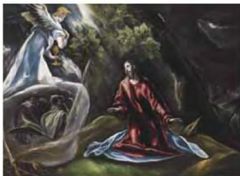
Δομηνικός Θεοτοκόπουλος, Αγνία στον κήπο της Γεσθθημιά (1610).

—Τα σημαντικά ευρήματα τα εξηγώ πιο κάτω. Σαφείς απαντήσεις σε άλλες ερωτήσεις σας. Θα ήθελα, όμως, να αναφέρω εδώ ότι βάζω στη σωστή τους θέση για τη σωστή τους θεώρηση πολλά στοιχεία, τα οποία αλλοίωσαν σε σημείο απίστευτο τον Γκρέκο, τη δουλειά του και τη ζωή