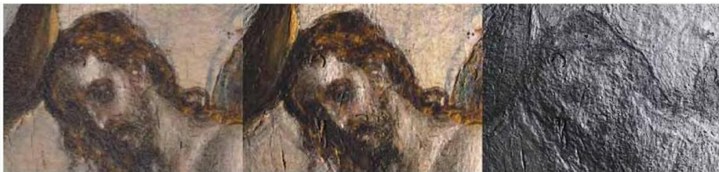
Αποτελέσματα τεχνικής φωτογράφισης από τη «Βάπτιση» του Δομήνικου Θεοτοκόπουλου.